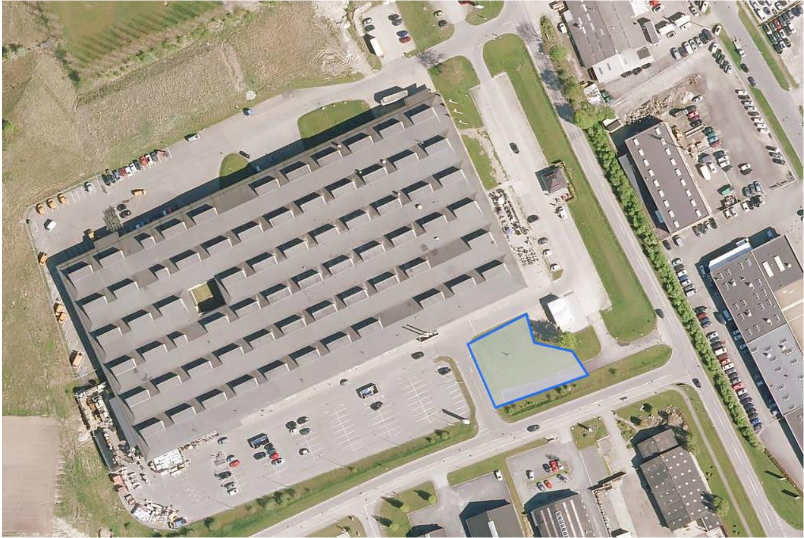
Tankstation på synlig hjørne